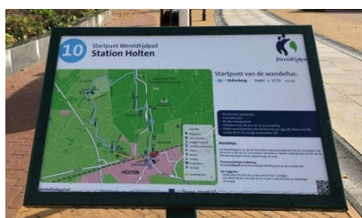
Startpunt Station Holten

Op deze zijde van de sculptuur staat de tekst 'Een mens zonder geschiedenis is als een boom zonder wortels'. Op de andere zijde is te lezen: 'Geschiedenis is het heden gezien door de toekomst'.