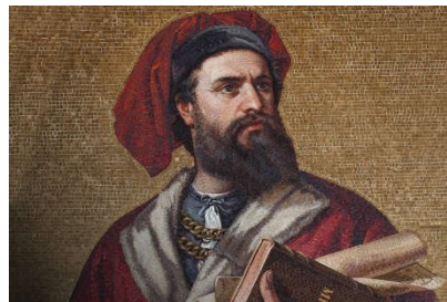
Marco Polo

Boonstra. De route loopt o.a. langs stuwwallen, 'bergen', moerassen en beken die in een ver verleden zijn ontstaan.