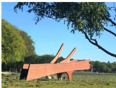
Uitzichtpunt De beuk achter station Holten