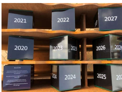
Links onder de jaarkubus van 2019

De sculptuur is opgebouwd uit vier cortenstalen platen waar tussen in totaal 51 kubussen zijn aangebracht. De eerste kubus informeert over gebeurtenissen uit 2019. Op de andere kubussen staat nu nog alleen een jaartal. De reeks loopt door tot 2060. Aan het einde van een jaar zal telkens een keuze worden gemaakt uit gebeurtenissen die dat jaar hebben plaats gevonden. Die komen dan op de betreffende informatiekubus te staan.