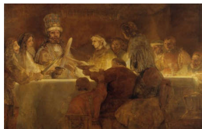
Julius Civilis en de stamhoofden van de Bataven leggen de eed van trouw af (Rembrandt, Wikipedia)

Ook nieuw: Het raadsel van het meisje van Yde. Yde is een dorpje boven Assen. In 1897 ontdekten een paar turfstekers in de buurt de restanten van een meisje dat daar kennelijk al heel lang lag. En dat klopt. Het 'meisje van Yde' leefde rond het begin van de jaartelling. Wat is er met haar gebeurd? In welke wereld leefde ze? Tijdens een rondje Oosterhof (periode 1-160) ga je op zoek naar antwoorden op deze en andere vragen.