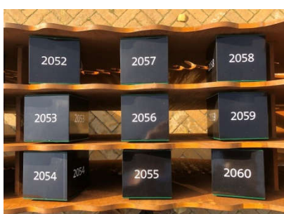
Er is ruimte voor jaarkubussen tot 2060