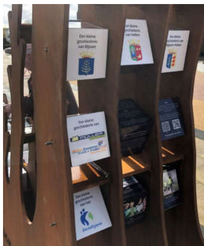
Een apart groepje kubussen in het verticale deel van de Wereldtijdboom vertelt de beknopte geschiedenis van Rijssen-Holten, sponsor Müller en het Wereldtijdpad.