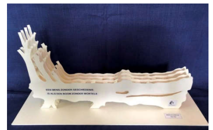
Model van de Wereldtijdboom

Met het oog op de beschikbare ruimte hebben we er voor gekozen nog één sculptuur te plaatsen als (voorlopig) sluitstuk van het Wereldtijd, waarmee we tot 2060 vooruit kunnen.