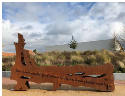
Wereldtijdboom op het plein voor station Holten

Op deze zijde van de sculptuur staat de tekst 'Een mens zonder geschiedenis is als een boom zonder wortels'. Op de andere zijde is te lezen: 'Geschiedenis is het heden gezien door de toekomst'.